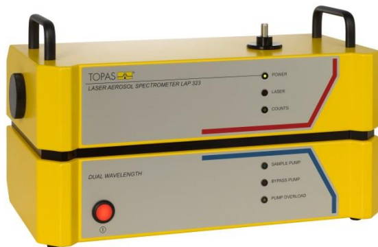
Laser Aerosol Spektrometer LAP 323.

Mit dem neuen Einzelpartikel-Streulicht-Spektrometer LAP 323 wird die innovative Dual Wavelength Technologie der Topas GmbH für die Partikelgrößen- und anzahlbestimmung eingeführt.